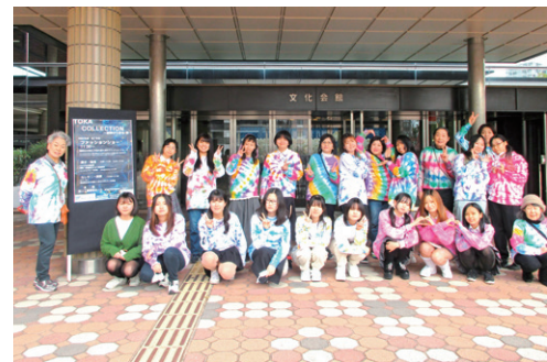
タイダイ染で染めたトレーナー集合