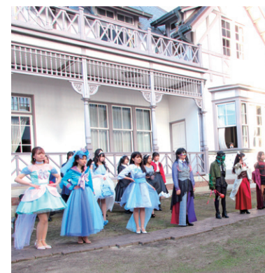
Different worldを生きる：独自の世界をデザインに！

●半田市雁宿ホールでTOKA COLLECTION開催！白のトレーナーを一人一人が染めたカラフルな衣装で接客し、好評をいただきました。ファッションショーも割れんばかりの大拍手。